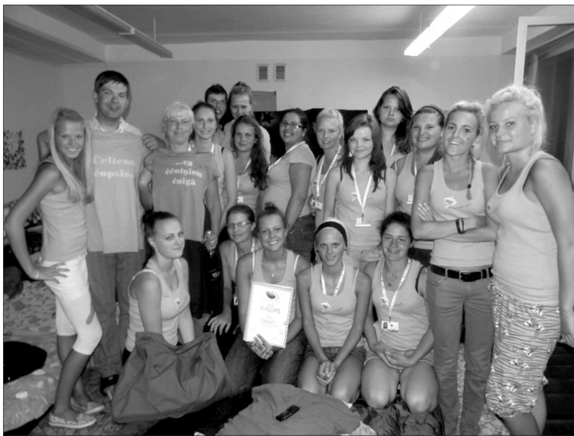
Latvijas labāko vidusskolas meiteņu koru konkurencē Rojas Kultūras centra meiteņu koris izcīnīja zelta diplomu, 3. vietu un 100 latus balvā.