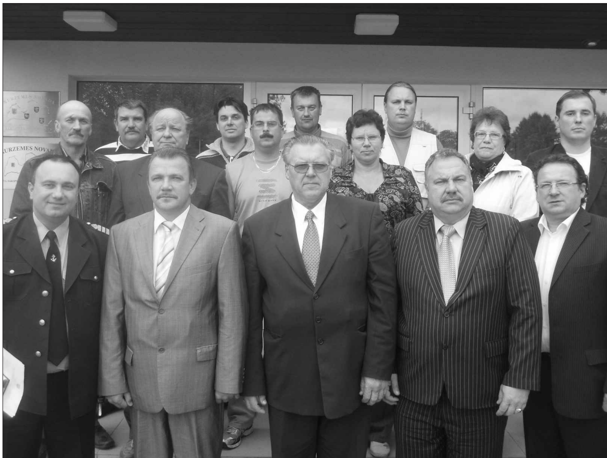
Vēsturisks foto. Rojas novada pirmā dome pēc pēdējās sēdes 2009. gada 9. jūnijā.