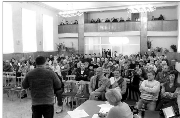
Iedzīvotāju sapulce 24. oktobrī tautas namā bija kupli apmeklēta.