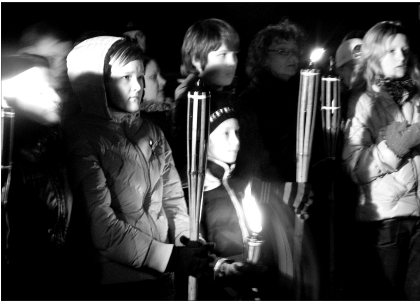
11. novembrī pie Piemiņas akmens.

Priecīgus svētkus, stipru veselību un veiksmi ikdienā!