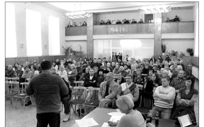
Iedzīvotāju sapulce 24. oktobrī tautas namā bija kupli apmeklēta.