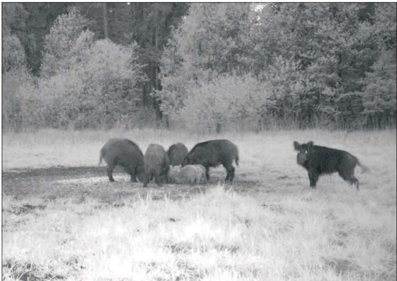
Mērsraga meža iemītņieces.