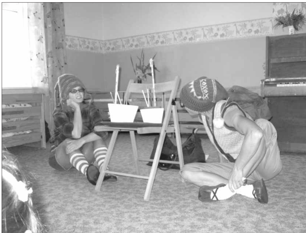
Jaunais darba cēliens ir uzsākts ļoti labi. Par to spriež rūķi abi. Zinību dienā.