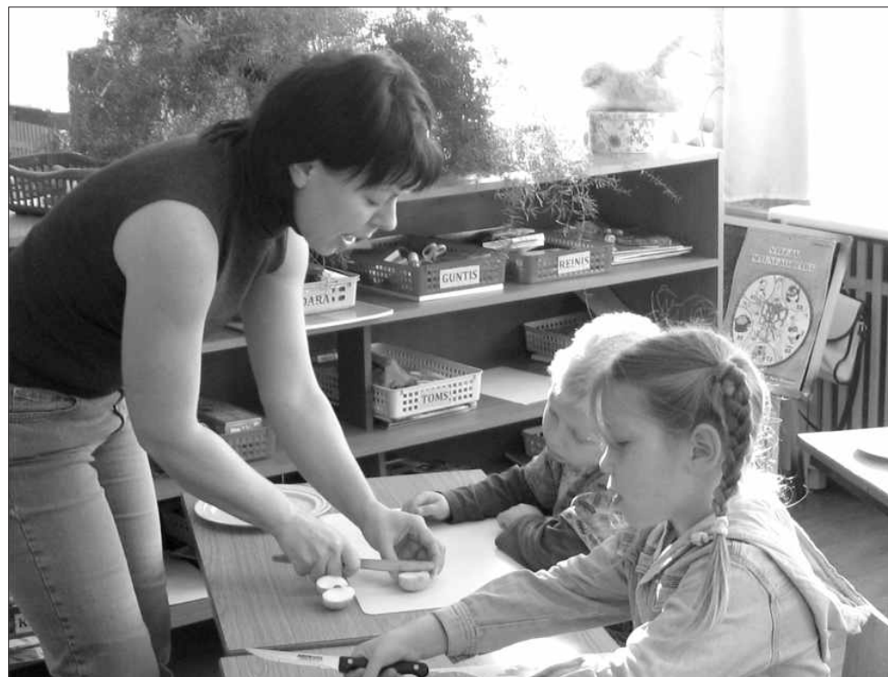
Lai ir mazas rokas, tomēr visi darbi labi sokas — «Salātu dienas» visās grupās.