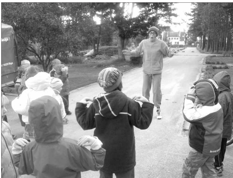
Veselība dārga mums ikvienam, tāpēc sportojam un skrienam. Pasākums «Sveiks un vesel!»