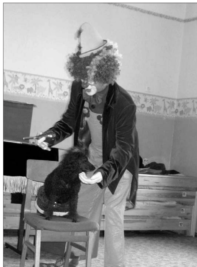
Dārtā ciemojās kāds klauns — Par to priecājas gan vecs, gan jauns.