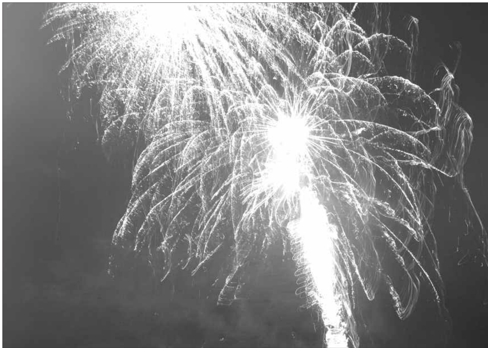
2007. gada 31. decembris.

Jauns gads esot jāsāk ar apņemšanos kaut ko mainīt savā dzīvē. Var, protams, mēģināt atnest smēķēšanu, nomest lieko svaru, bet, šķiet, tas ir tikpat utopiski un bezcerīgi, kā apņemties nemelot, netenkot, neuzskatīt sevi par pasaules nabu. Ir vai aizkustinoši pavērot, kā tieši vislielākie melneši un tenkuvāceles patiesā sašutumā taisnojas, kad aiz rokas pieķerti savos nedarbos. Nu labākajā gadījumā skan Pindaciša cienīga atbilde: ko ta es, es jau neko. Un tā mēs katrs pievienojam pa darvas pilienam tam kopējam melnumam, kas dažam licis apgalvot: es mīlu šo zemi, bet nemīlu šo valsti. Vispār jau divains apgalvojums, jo vai tad mēs paši neesam šī valsts, vai tad šī valsts neveidojas no mūsu katra viena domām, darbiem un nedarbiem? Nu jā, bet es jau esmu tas labais, ko ta es, es jau neko. Taču šo lietu var pavērst arī citādi. Ja nu mēs, uzsākot jauno gadu, apņemtos katru dienu tikai vienam cilvēkam pateikt labu vārdu? Tikai vienam, bet katru dienu.