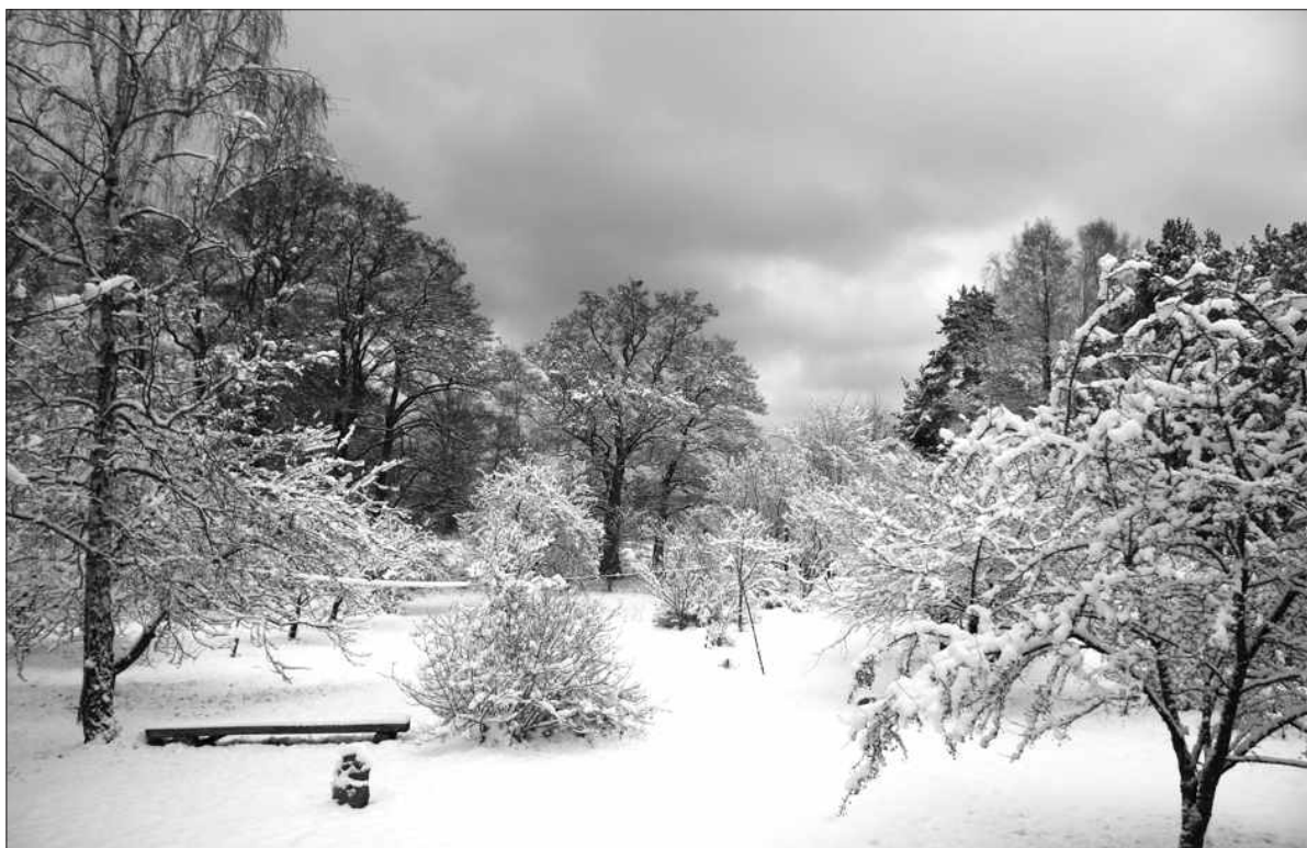
2008. gada 1. janvāris.