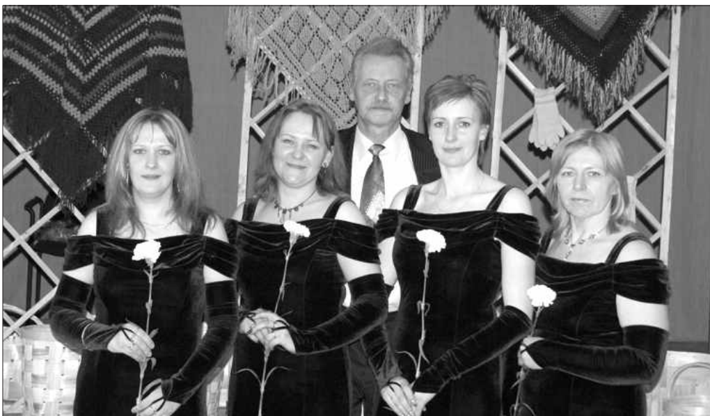
Vokālais ansamblis „Kapriže” Lieldienās bija uzaicināts dziedāt Valdgales Tautas namā.