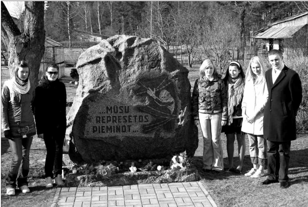
25. martā notika atceres brīdis pie represēto piemiņas akmens. Piedalījās arī Mērsraga vidusskolas pārstāvji.