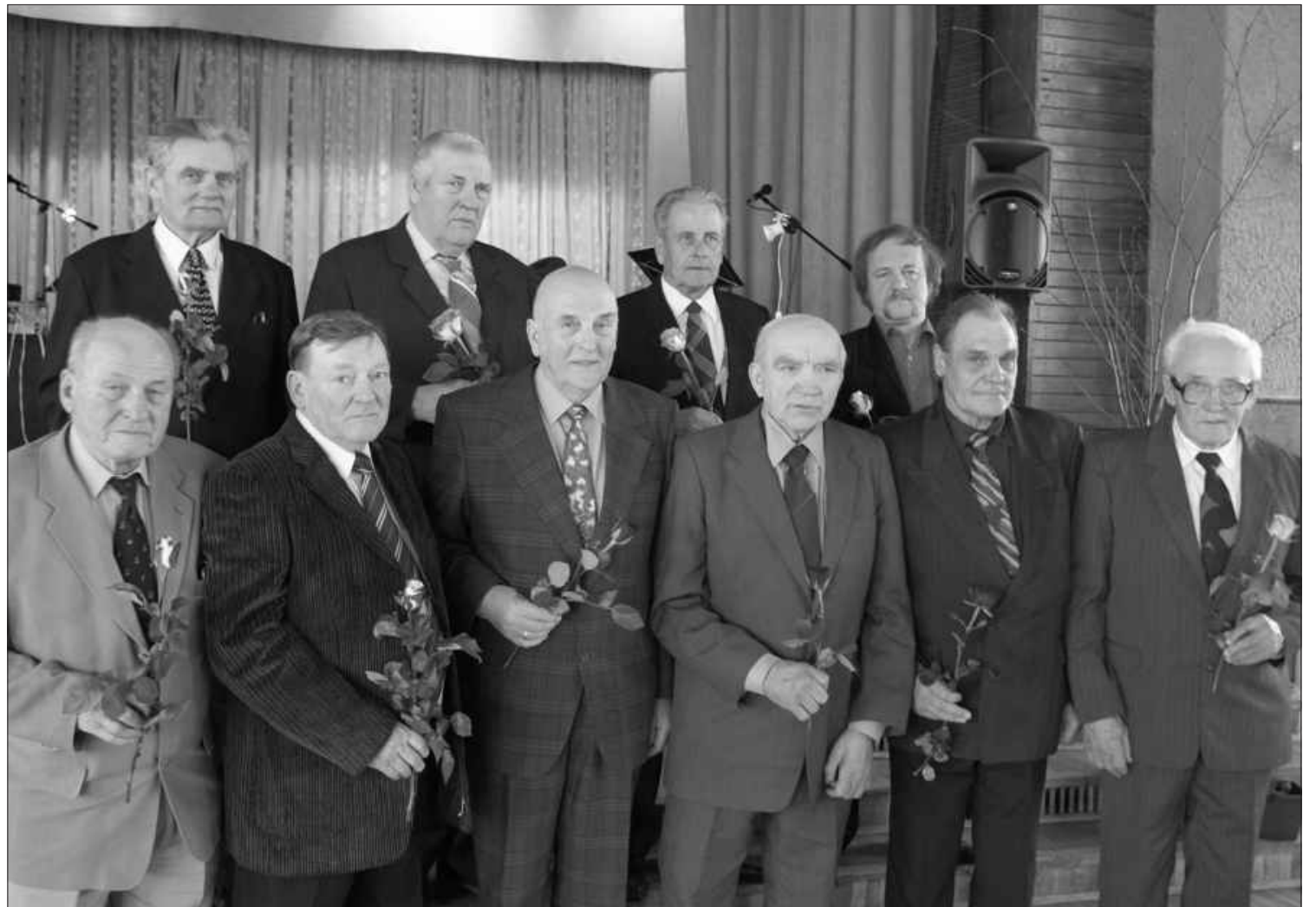
Nu jau tradicionāli uz kopēju atpūtas vakaru 24. martā Tautas namā bija pulcējušies mūsu zvejnieki.

Mēs nepriecājamies par to, kas mums ir, bet sūkstāties par to, kā mums nav. Šī sūkstīšanās pat esot kļuvusi par latvietim raksturīgu īpašību. Var jau būt, ka tā arī ir. Var jau būt, ka tas nepieciešams mūsu attīstībai, progresam. Mēs esam kļuvuši apātiski. Ikdienā redzot un pārliecinoties par to, ka no mums nekas nav atkarīgs, ka viss tiek izlemts bez mūsu līdzdalības, ka par mums atceras tikai pirms vēlēšanām, tāda apātija arī var rasties. Taču, ja rūpīgāk pavērsimies mūsu pašu ciema un plašāk, visas valsts dzīvē, tad nevarēsim noliegt, ka bieži vien pat viena, atsevišķa cilvēka iniciatīva, ja tā ir dzīvē un patiesībā dibināta, izsauc tālāku reakciju, un pozitīvas pārmaiņas notiek. Mums mēģina iestāstīt, ka parakstu vākšana un referendums nav nepieciešami, ka valdība savas kļūdas sapratusi un tās tiks izlabotas. Var jau būt, ka izlabos, bet pēc tam kļūdsies atkal. Un tās jau tikai nosacīti ir kļūdas. Īstenībā tā ir labi apzināta rīcība, kas dibināta visatļautībā, pārliecībā par to, ka apātiskā tauta jau neko nesaprot. Nu ko, turpināsim demokrātijas mācībstundas, un arī maksāsim bargu skolas naudu. Galu galā, mēs taču algojam savus priekšstāvjus un arī maksājam par viņu kļūdām. Un, ja viņi to aizmirst, tad jāatgādina. Skaidri. Saprotami. Demokrātiski.