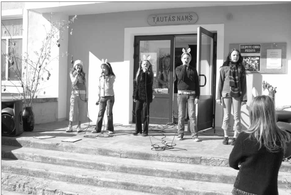
Lieldienu rītā pie Tautas nama dziedāja mūsu bērnu ansamblis „Fukši”. Bija rotaļas, dejas, mīklu minēšana.