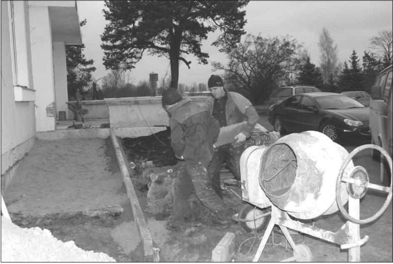
Tagad pie Tautas nama ir uzbrauktuve cilvēkiem ratiņkrēslos. Kļuvusi vieglāk pieejama bibliotēka un arī pasākumi lielajā zālē.