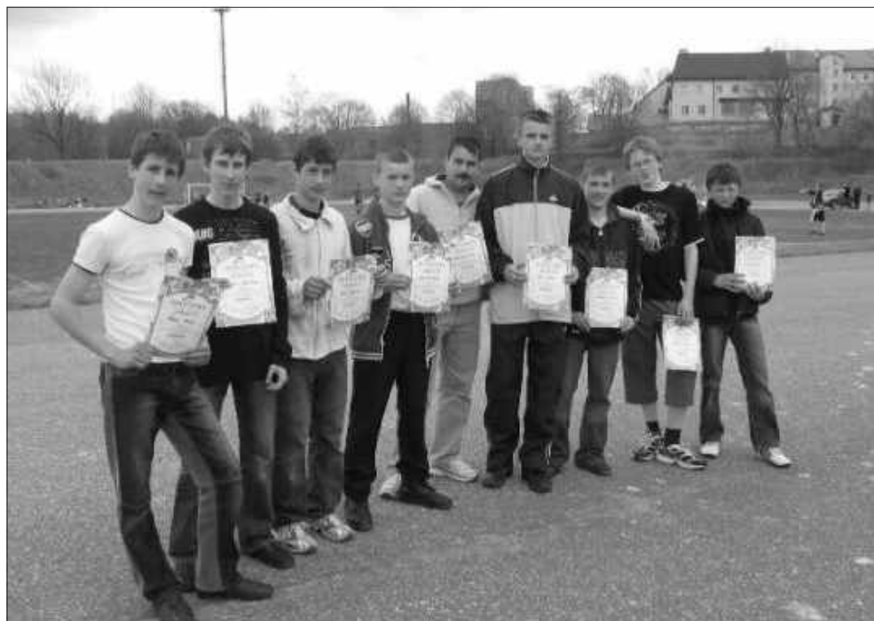
Jauniešu futbols, trešā vieta Talsu rajonā.