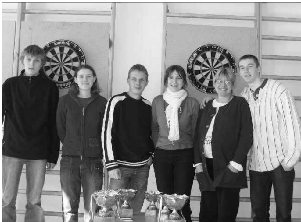
Mērsraga kausa izcīņa šautriņu mešanā.