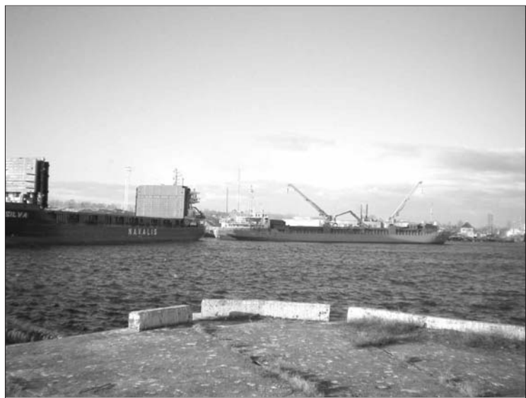
2008. gadā Mērsraga ostas kravu apgrozījums sasniedzis 500 tūkstošus tonnas.