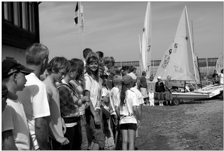
Dalībnieki ar nepacietību gaida Latvijas Jauniešu burāšanas čempionāta atklāšanu.

Pagājušā nedēļas nogalē Rojā pie ziemeļu mola piecdesmit dažāda vecuma jaunieši sacentās par Latvijas burāšanas čempiona titulu.