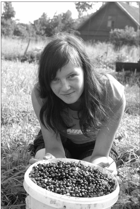
„Mēs esam priecīgi, kad ieejam un iznākam ar pilniem spaiņiem”.

Dinai pat patīk iepriecināt tuviniekus: „Šogad es sakrāju divdesmit latus, lai tos uzdāvinātu mātai dzimšanas dienā. Citus gadus no melleņu naudas es varēju atļauties uzdāvināt piecus, citreiz desmit latus.”