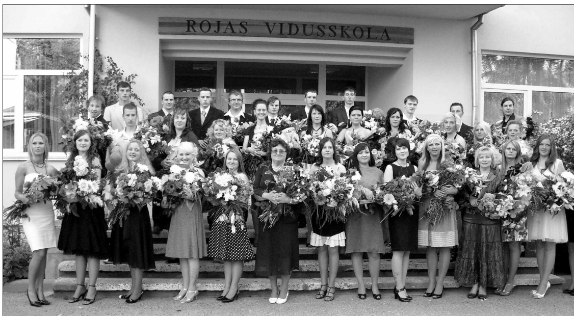
Rojas vidusskolas 12. klašu absolventi un viņu audzinātājas izlaiduma dienā 19. jūnijā.