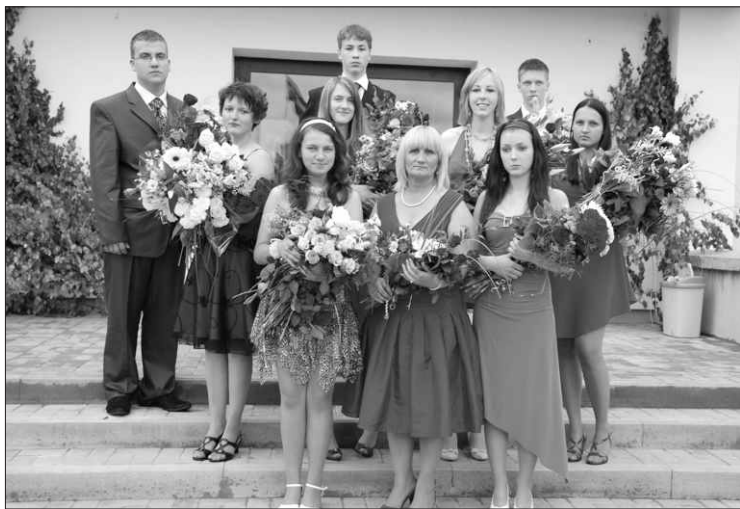
Mērsraga vidusskolas 9. klases absolventi.