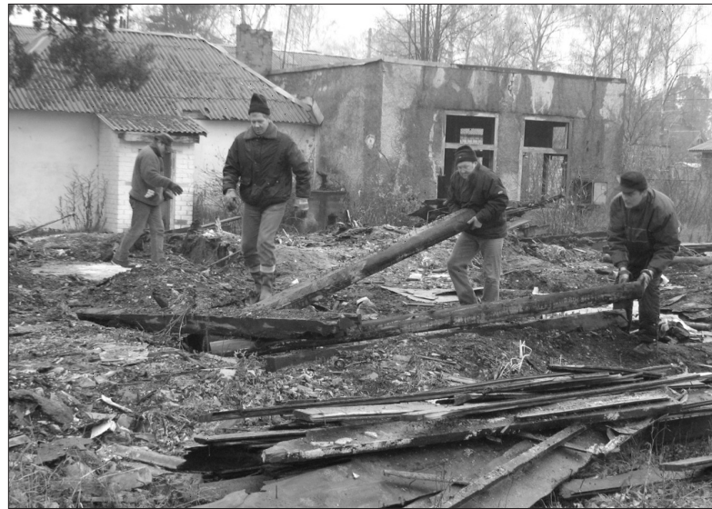
Vīri darbā pie nodegušās «Pabērzu» mājas nojaukšanas Mērsragā.