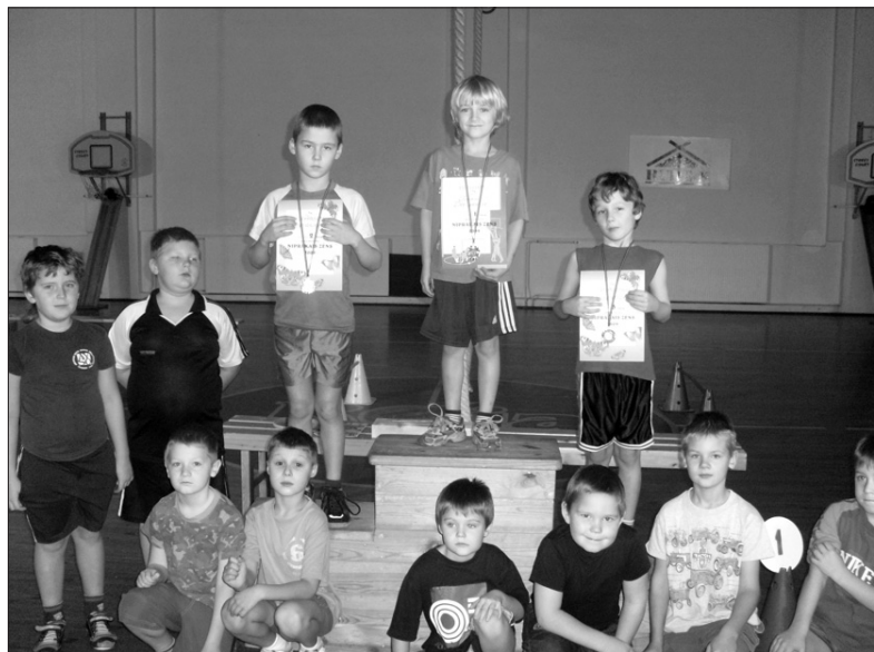
Ņiprākie puīši no pirmajām klasēm.