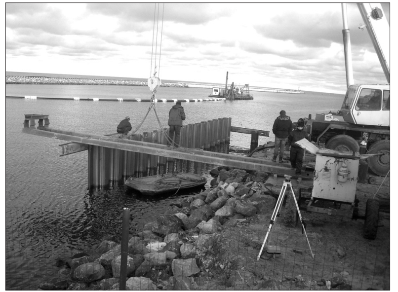
Mērsraga ostā tiek veikta krastu nostiprināšana un jaunu piestātņu būvniecība.