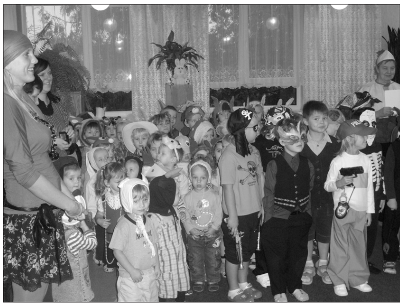
Zeme rīb, rati klauz, / Kas to zemi rībināja? Nu atbrauca Mārtiņdiena / Deviņiem kumeļiem.