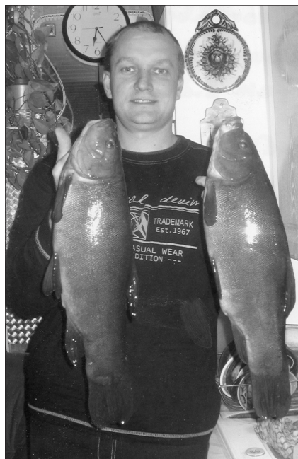
2009. gada Latvijas rekords, noķerts Mērsraga kanālā 29. novembrī – 13.30, 60 cm 3,646 un 57 cm 2.892.